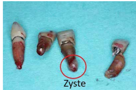
Schwarze Wurzeln von toten Zähnen mit Zysten

Es gibt zahlreiche Studien, die nachgewiesen haben, dass tote Zähne eine massive Belastung für den Körper und das Immunsystem darstellen. Grund hierfür ist, dass bei einer vom Zahnarzt durchgeführten Wurzelkanalbehandlung („Nerv ziehen“) der Zahn abgetötet wird, aber leider nie alles darin enthaltene Gewebe vollständig entfernt werden kann. Diese im Zahn verbleibenden Gewebereste und ihre Lage im Inneren des Zahnes, wo es dunkel, warm und feucht ist, stellen in der Folge den idealen Lebensraum für anaerobe Bakterien dar, was zur bakteriellen Besiedelung des toten Zahnes führt. Diese Bakterien produzieren durch ihren Stoffwechsel zum Teil hochgiftige Substanzen („Leichengifte“), welche nicht nur lokal am Zahn und im Kiefer zu Problemen führen, sondern vor allem auch über die Blutbahn im ganzen Körper verteilt werden und auf diese Weise zu weitreichenden Problemen führen. Oftmals treten dann Symptome und Krankheitsbilder auf, die scheinbar ohne Grund und plötzlich auftreten, und die eigentliche Ursache (Leichengifte aus toten Zähnen) wird nicht erkannt oder übersehen.