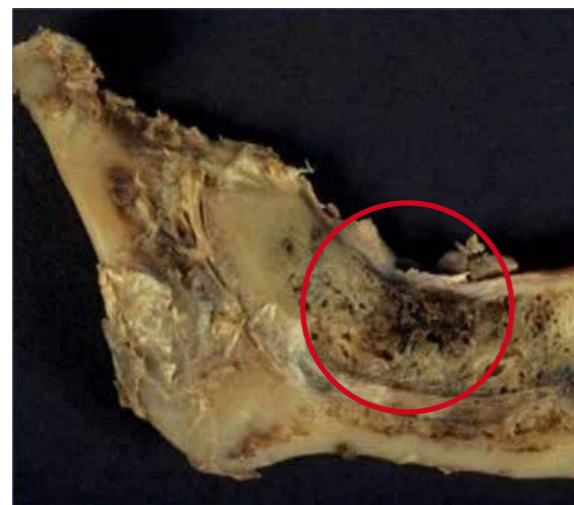
Abgestorbenes, totes Gewebe – NICO

Der Begriff NICO ist eine Abkürzung aus dem Englischen und beschreibt Hohlräume (Löcher) im Kieferknochen. Diese Hohlräume entstehen meistens, wenn Zähne (hier vor allem die Weisheitszähne!) gezogen werden und der Körper zu diesem Zeitpunkt nicht ausreichend mit Vitaminen und Mineralstoffen versorgt war. Diese Nährstoffe sind aber extrem wichtig für eine gesunde Heilung nach einer Zahnentfernung und ein Mangel daran führt zwangsläufig dazu, dass Hohlräume im Kiefer verbleiben. In Untersuchungen zeigte sich, dass sich diese Hohlräume im Laufe des Lebens mit Bakterien, Pilzen, Viren und Toxinen füllen können. Auch wurden bereits erhöhte Konzentrationen von Borrelien, Quecksilber und sogar Glyphosat in diesen Arealen gefunden. NICO's sind also mit Schadstoffen gefüllte Hohlräume, die lokal zwar nicht zu spüren sind, aber enorme Auswirkungen auf die Gesundheit und das Immunsystem haben können. Denn sie belasten über Ihre Streuwirkung im gut durchbluteten Kiefer den ganzen Körper.