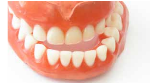
Deutlich zu sehen - ein nicht übereinstimmender Biss

Es gibt im Wesentlichen drei Gründe, warum die Zähne eine so herausragende Bedeutung für die Gesundheit haben: