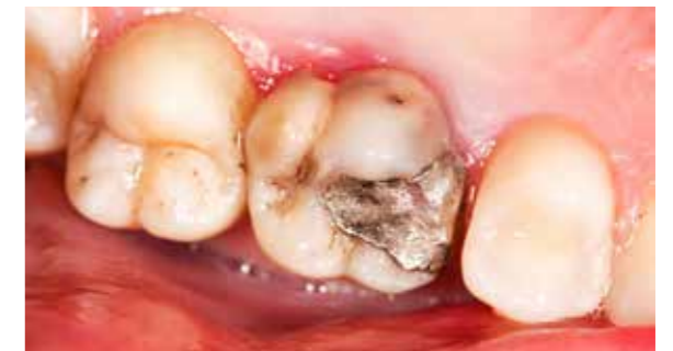
Ein kaputter Zahn – gefüllt mit Amalgam

Vor allem bei Amalgam ist die hochgiftige Wirkung vielfach nachgewiesen worden, denn Amalgam enthält bis zu 50% des toxischen Quecksilbers. Quecksilber ist eine der giftigsten Substanzen auf dieser Welt, ist extrem neurotoxisch (=Nervengewebe zerstörend) und wird stets als Sondermüll deklariert und behandelt. Trotz dieser Tatsachen wurde und wird es noch immer in die Zähne vieler Menschen eingebracht, ohne auf die zum Teil verheerenden Auswirkungen zu achten, welche sich dadurch zum Teil erst Jahre später für die Patienten einstellen. In vielen Ländern der Welt ist deshalb der Einsatz von Amalgam zum Teil schon seit mehreren Jahrzehnten gesetzlich verboten!