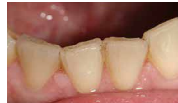
Die Frontzähne schleifen sich beim Knirschen gegenseitig ab – ein deutlicher Hinweis für belastende Kräfte

Ein falscher Biss macht Schmerzen - entweder akut oder im Laufe des Lebens. Denn über eine Fehlbelastung wie zum Beispiel das Zähneknirschen in der Nacht werden massive Kräfte von bis zu 50 kg auf die Halswirbelsäule und den gesamten Halteapparat der Wirbelsäule eingeleitet - und das oft dauerhaft über mehrere Jahre. So führt Zähneknirschen oft nicht „nur“ zu vermehrtem Abrieb an den Zähnen und Schmerzen im Bereich des Kiefergelenks und der Kaumuskulatur, sondern kann auch ernsthafte Haltungsschäden zur Folge haben.